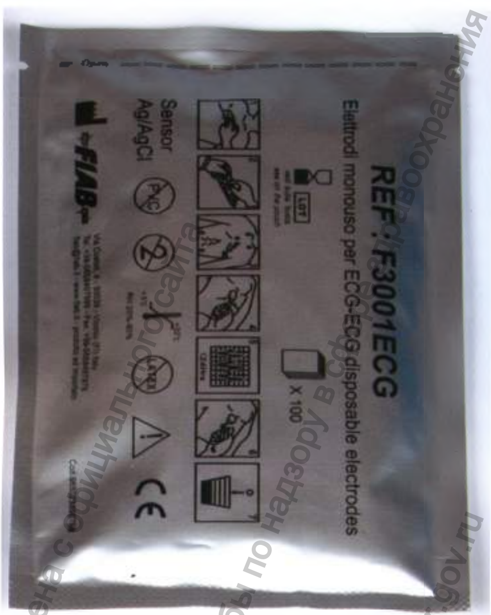
Электрод одноразовый в упаковке

Информация получена с официального сайта Федеральной службы по надзору в сфере www.goszdravnadzor.gov.ru Янтарного хранилища