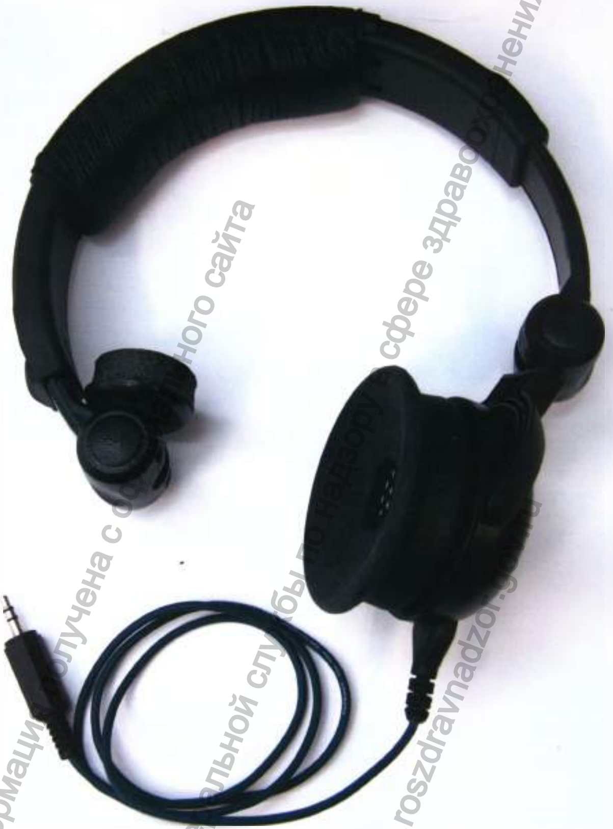
Слуховой стимулятор «TDH-39» односторонний