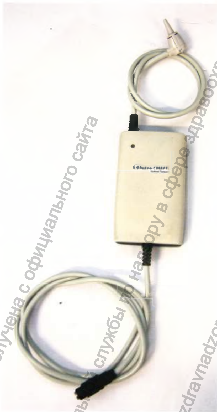
Блок для импедансометрии «Аудио-СМАРТ»

Информация получена с официального сайта Федеральной службы по надзору в сфере здравоохранения www.gozdravnadzor.gov.ru