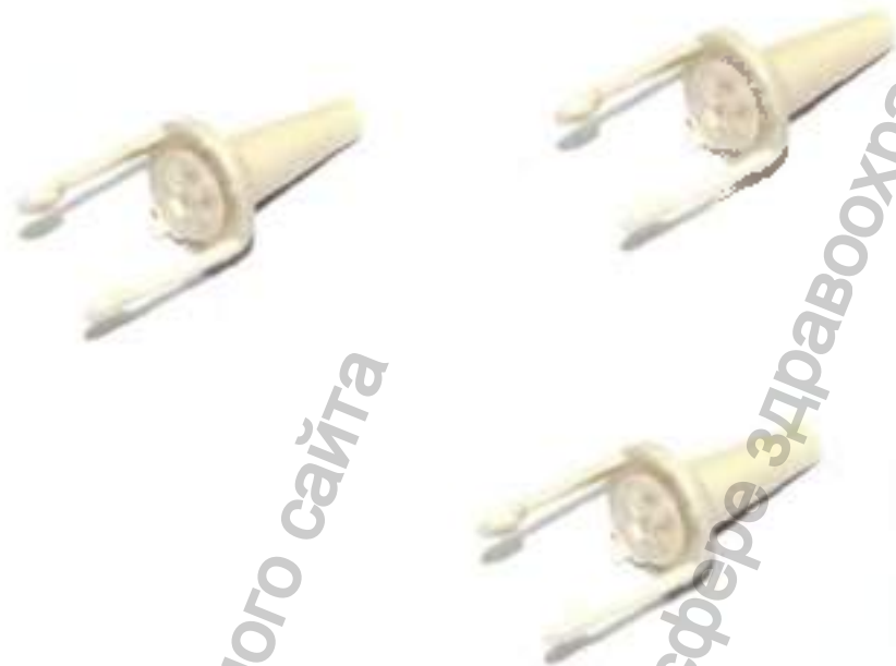
Наконечник к зонду ОАЭ