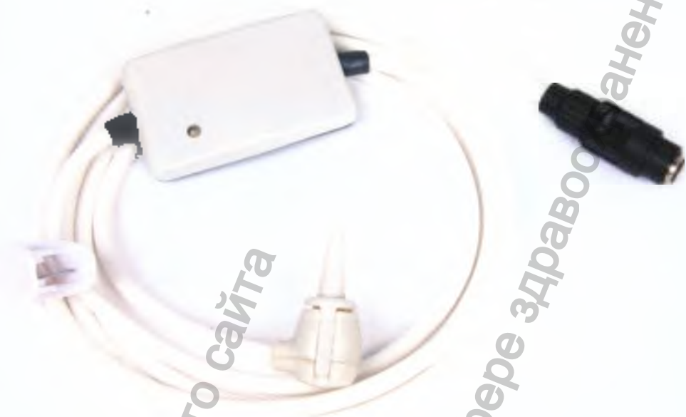
Зонд для регистрации ОАЭ «ОАЭ-04-2»