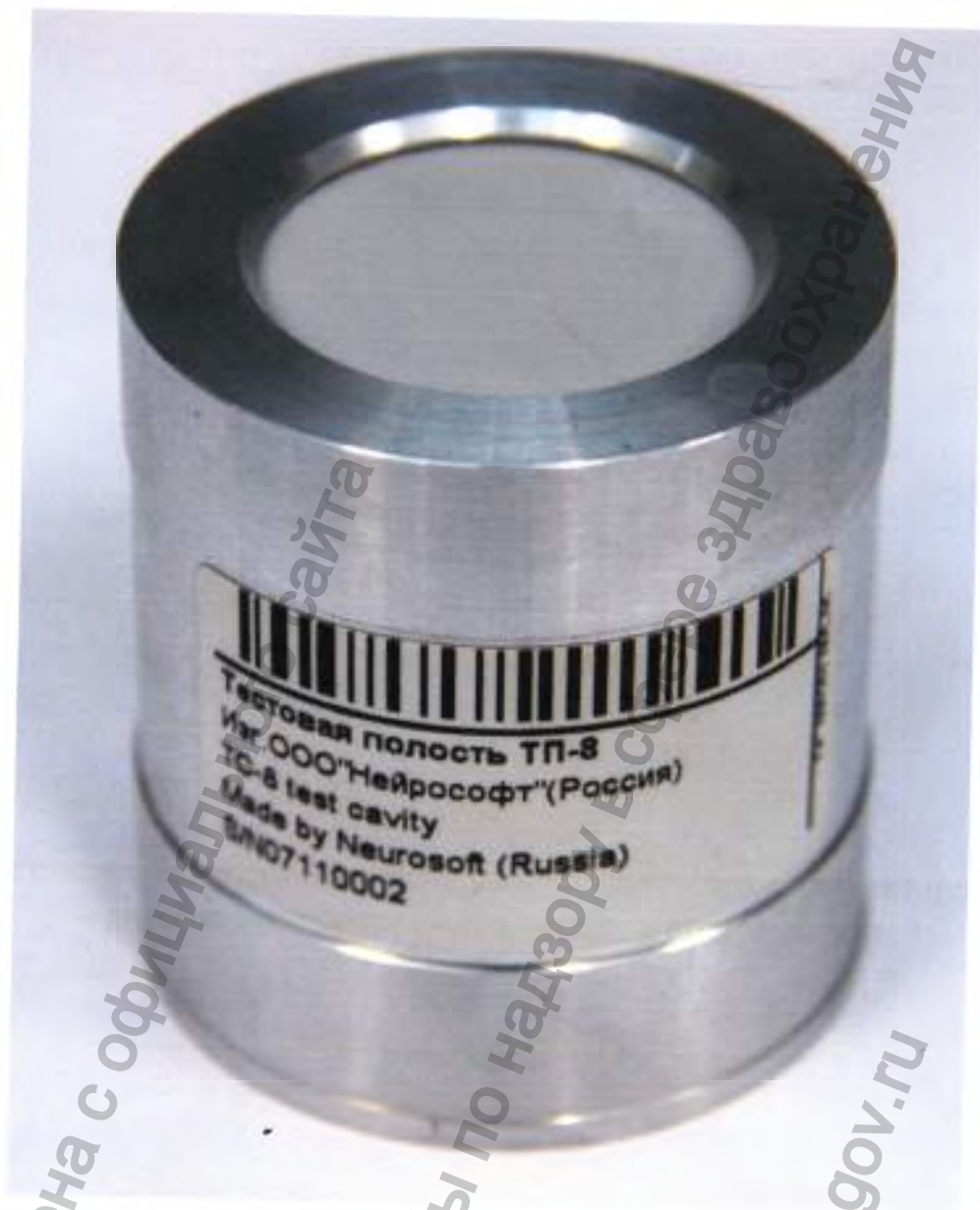
Полость тестовая «ТП-8»

Информация получена с официального сайта Федеральной службы по надзору в сфере здравоохранения www.goszdravnadzor.gov.ru