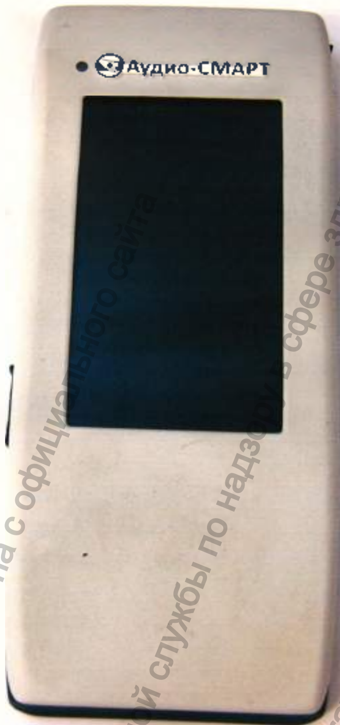
Блок электронный «Аудио-СМАРТ»

Информация получена с официального сайта Федеральной службы по надзору в сфере здравоохранения www.goszdramnadzor.gov.ru