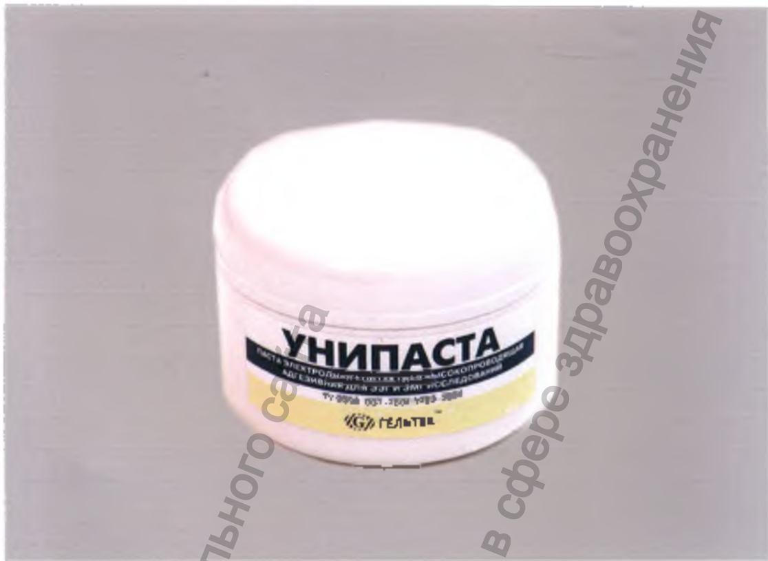
Паста электродная контактная