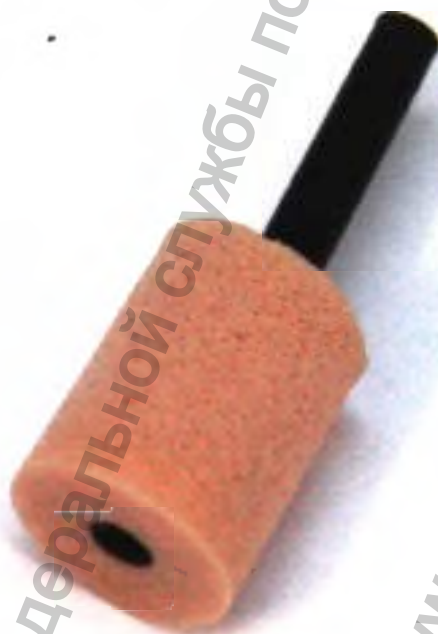
Комплект вкладышей ушных к аудиометрическим телефонам ER3-14B

Информация получена с официального сайта Федеральной службы по надзору в сфере здравоохранения www.gosdramnadzor.gov.ru