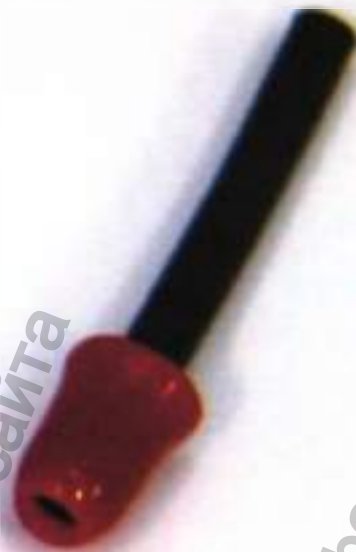
Комплект вкладышей ушных к аудиометрическим телефонам ER3-14D2