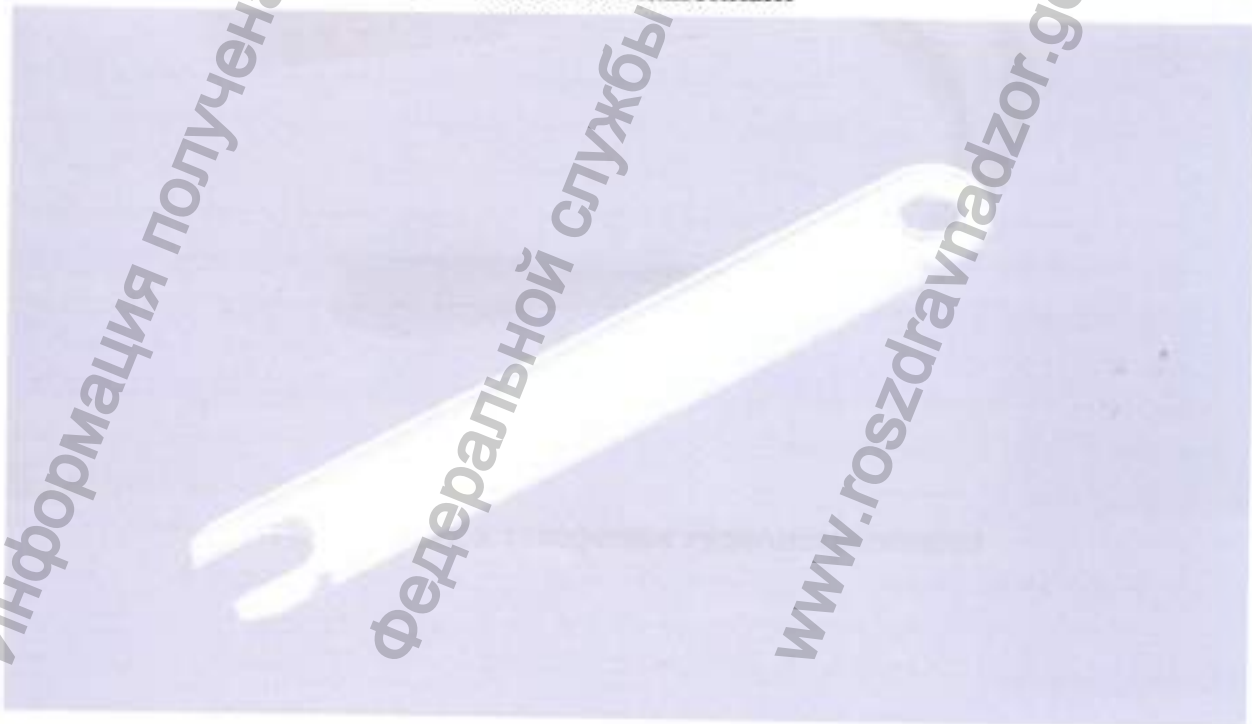
Съемник наконечника зонда

Информация получена с официальной интернет-страницы Федеральной службы по надзору в сфере здравоохранения www.goszdravnadzor.gov.ru