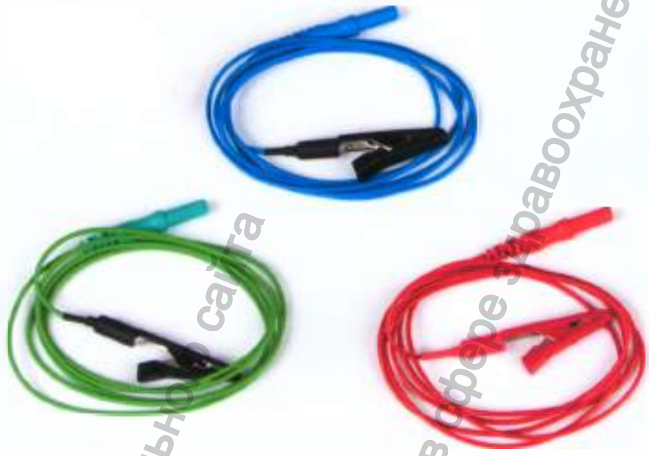
Кабель для подключения одноразового электрода с коннектором «аллигатор», touch-proof, зеленый, синий, красный