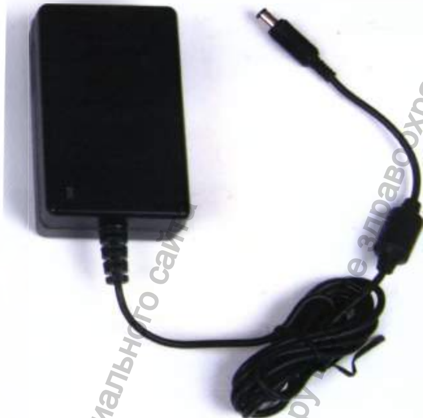
Блок питания «БЦМ-9»

Информация получена с официального сайта Федеральной службы по надзору в сфере здравоохранения www.goszdramnadzor.gov.ru