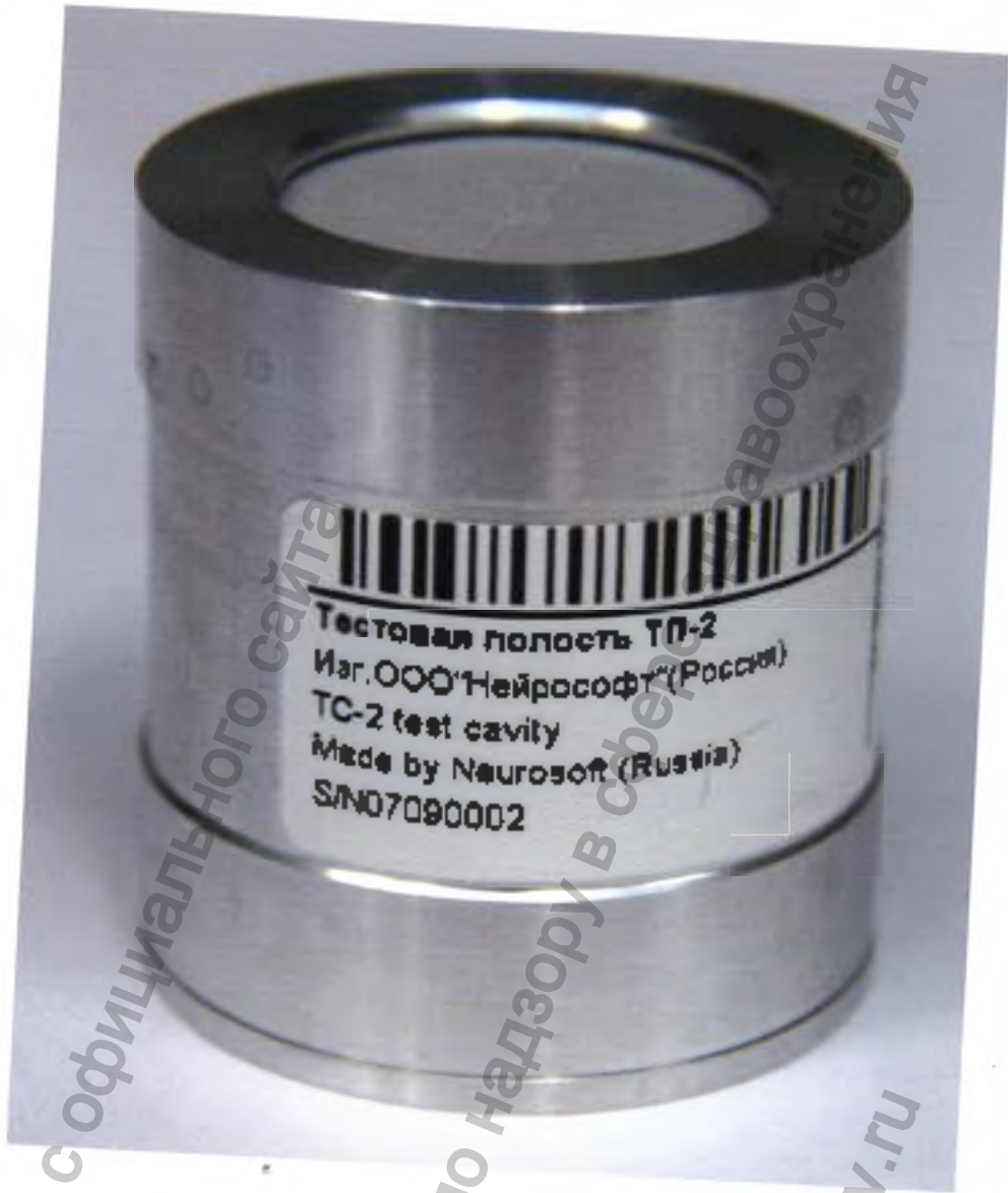
Полость тестовая «ТП-2»

Информация получена с официального сайта Федеральной службы по надзору в сфере www.roszdravnadzor.gov.ru Правоохранения