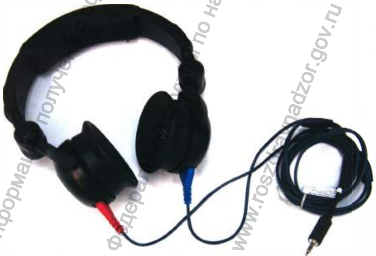
Слуховой стимулятор (аудиометрические наушники) «TDH-39»