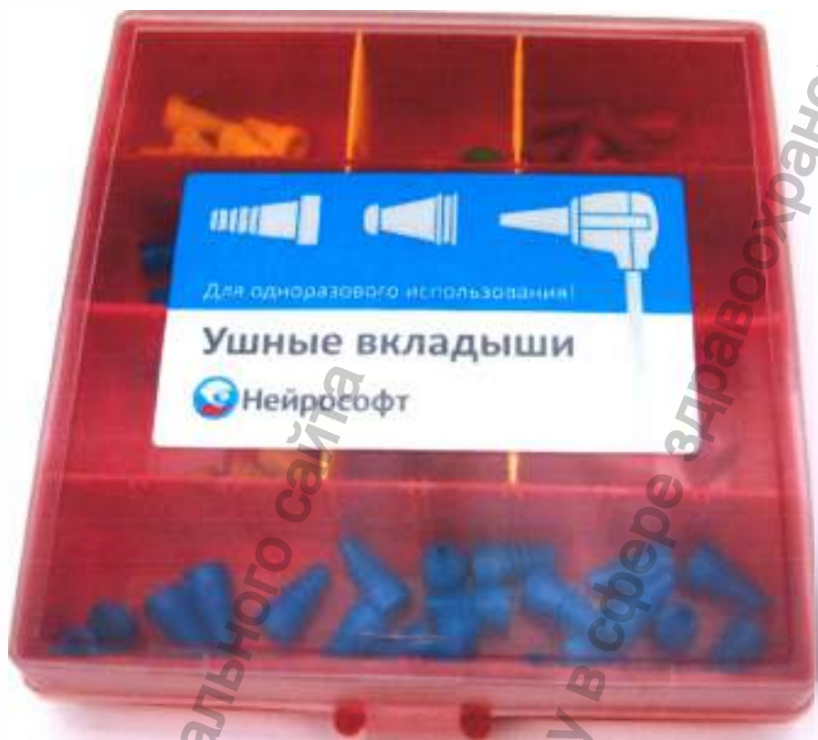
Комплект вкладышей ушных «детский»