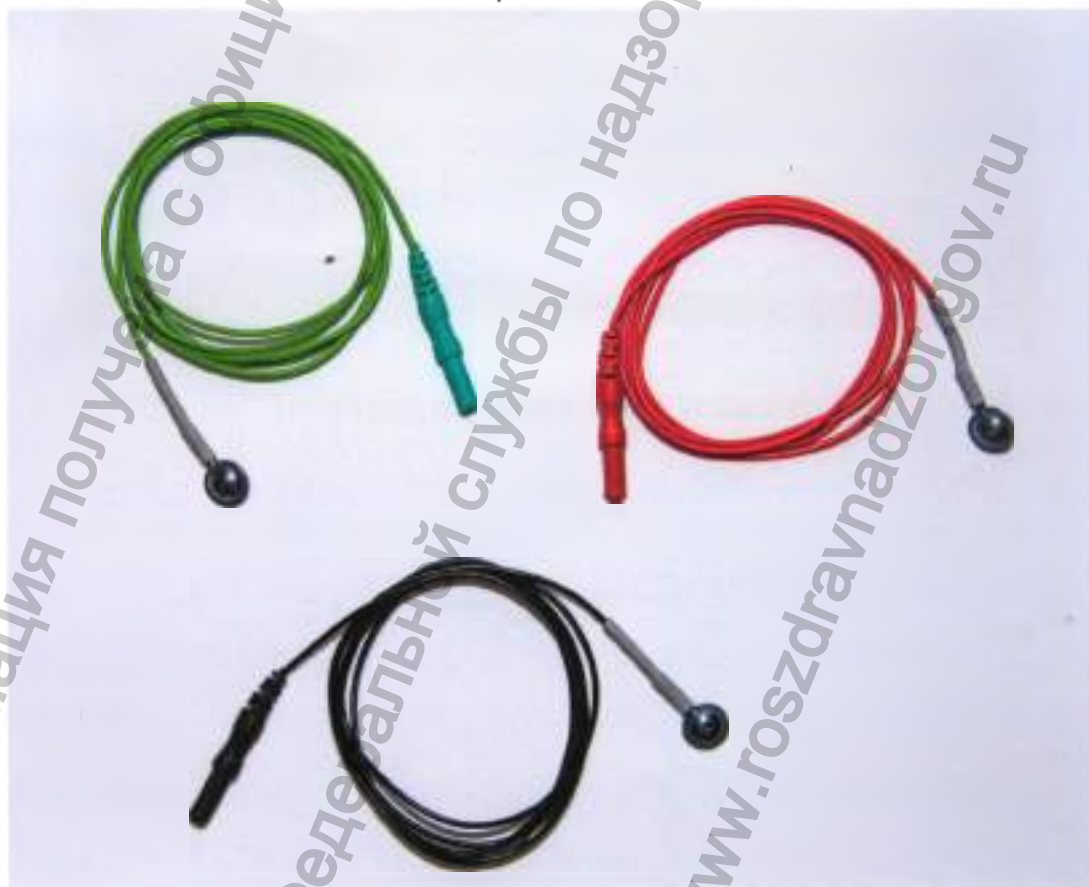
Электрод ВП чашечковый с кабелем отведения «ЭВП», зеленый, красный, черный