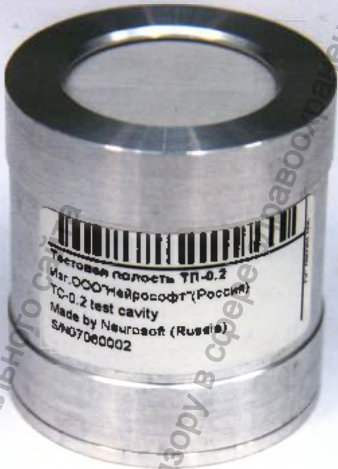
Полость тестовая «ТП-0,2»

Информация получена с официального сайта Федеральной службы по надзору в сфере здравоохранения www.goszdravnadzor.gov.ru