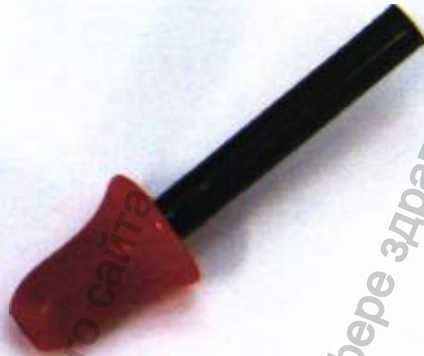
Комплект вкладышей ушных к аудиометрическим телефонам EK3-14P2