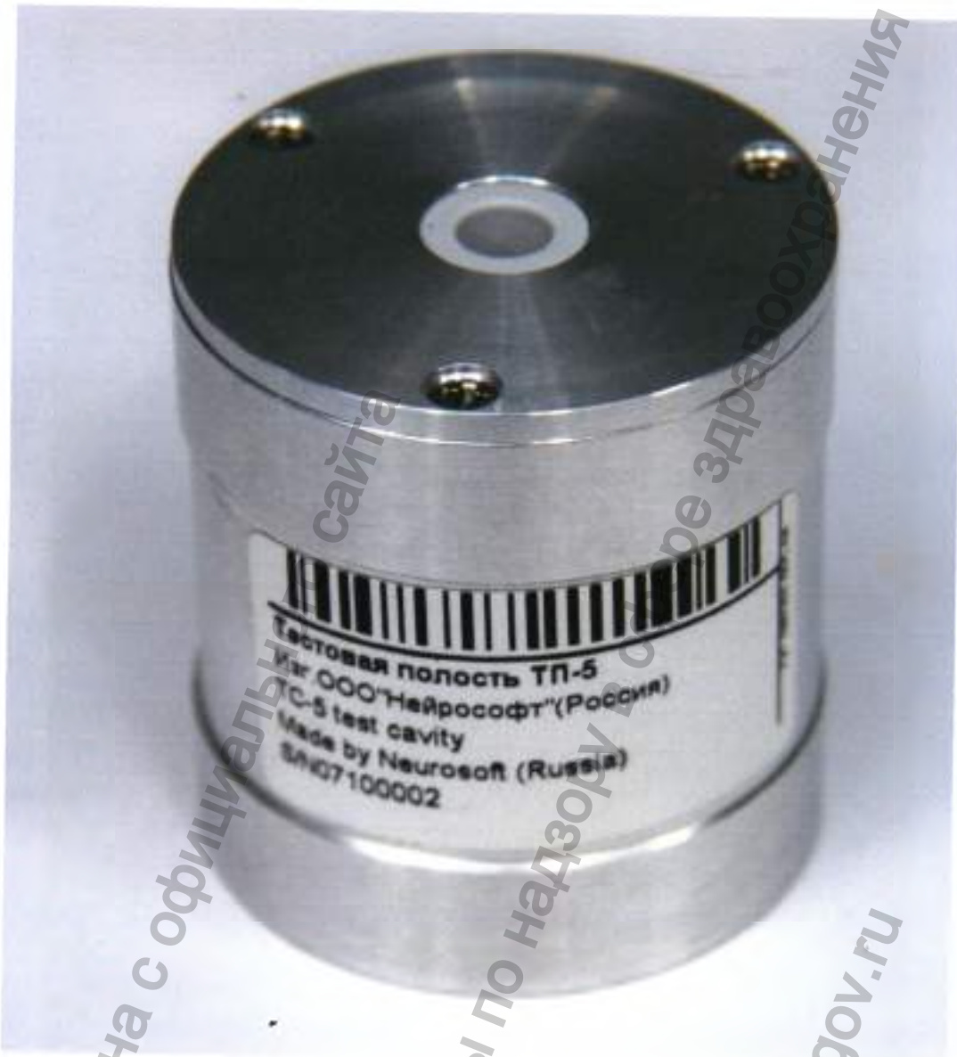
Полость тестовая «ТП-5»

Информация получена с официального сайта Федеральной службы по надзору в сфере здравоохранения www.goszdravnadzor.gov.ru