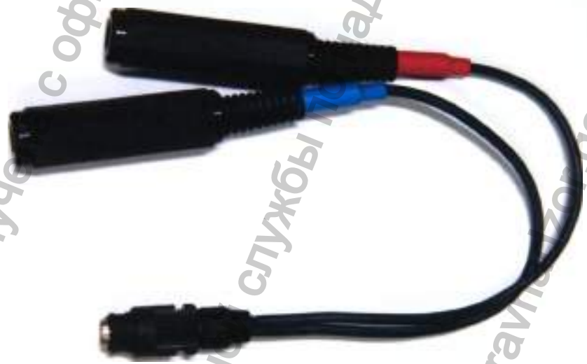
Переходник к телефонам аудиометрическим

Информация получена с официального сайта Федеральной службы по надзору в сфере здравоохранения www.goszdravnadzor.gov.ru