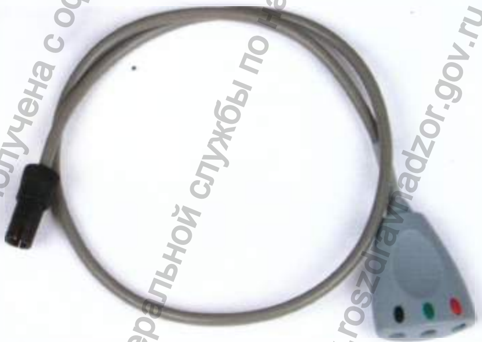
Кабель для подключения электродов

Информация получена с официального сайта Федеральной службы по надзору в сфере здравоохранения www.goszdramadzor.gov.ru