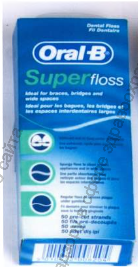
Зубная нить для чистки кончика зонда Superfloss Regular

Информация получена с официального сайта