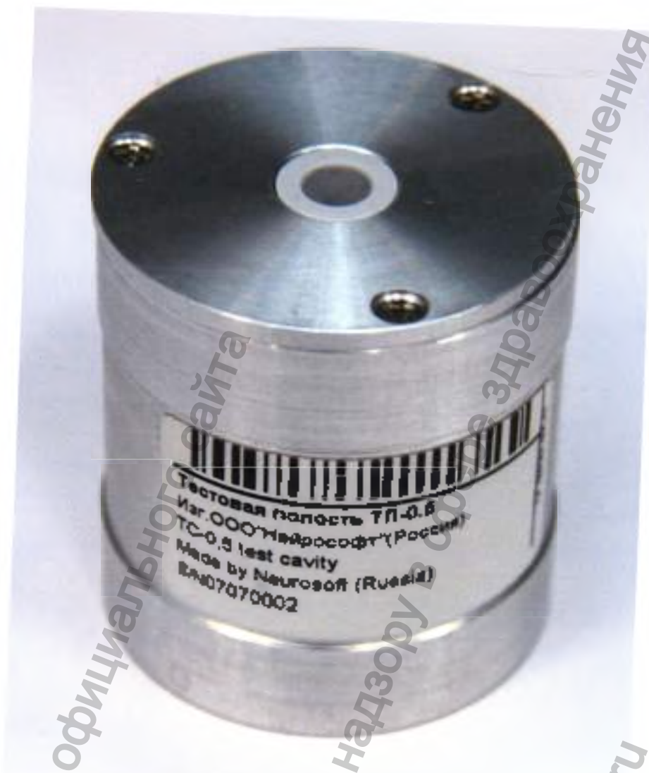
Полость тестовая «ТП-0,5»

Информация получена с официального сайта Федеральной службы по надзору в сфере здравоохранения www.goszdravnadzor.gov.ru