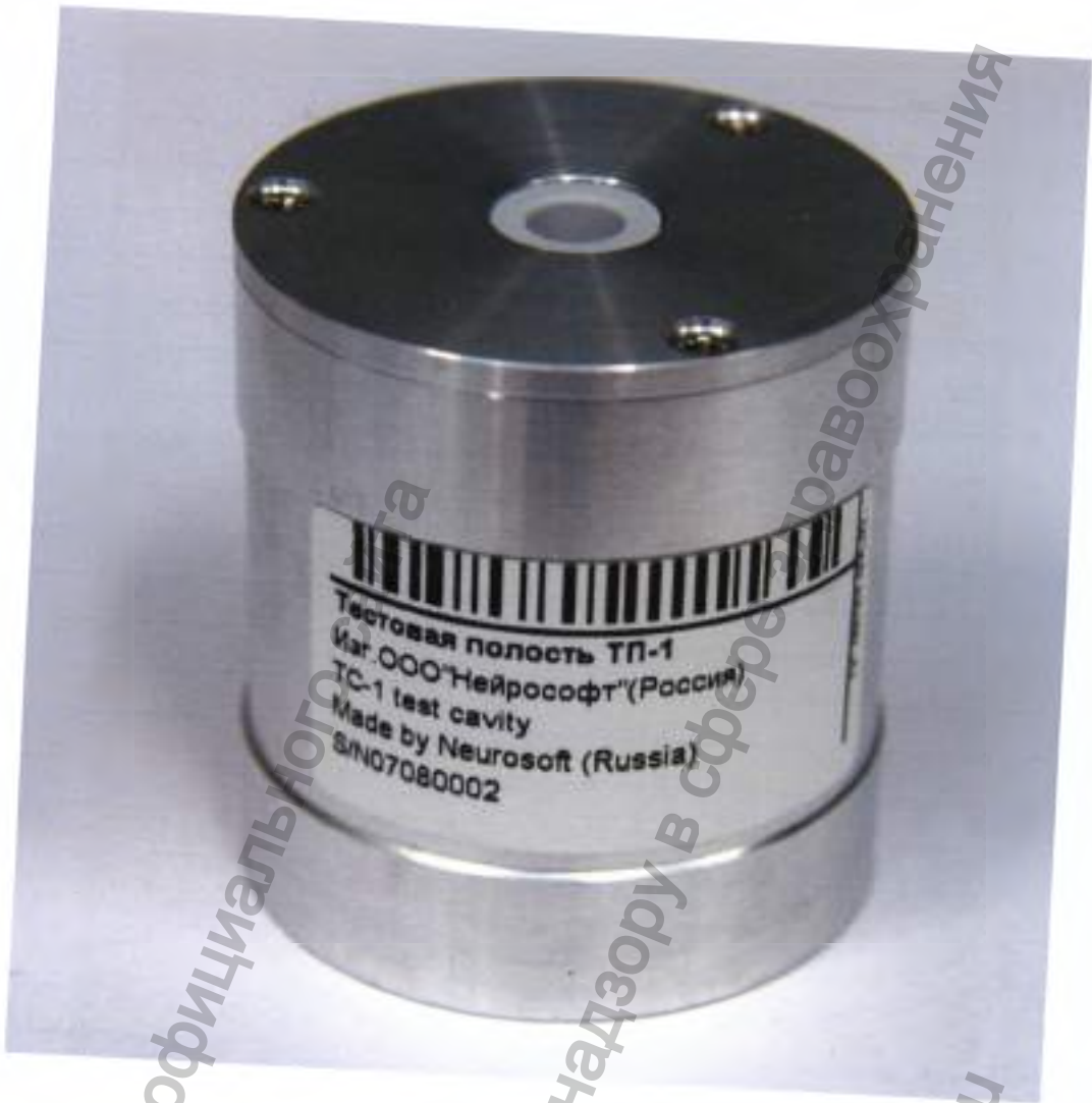
Полость тестовая «ТП-1»

Информация получена с официального сайта Федеральной службы по надзору в сфере здравоохранения www.goszdravnadzor.gov.ru