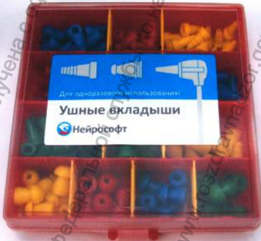
Комплект вкладышей ушных «универсальный»